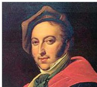
ORGOGGIO ITALIANO Verdi e Rossini (nella foto) saranno interpretati dalla Filarmonica Arturo Toscanini di Parma